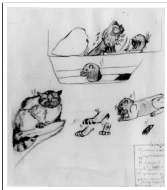
Н. Рерих. Зарисовки зверей. 1880-е.

Охотничья газета. 1891. 21 октября. № 42.