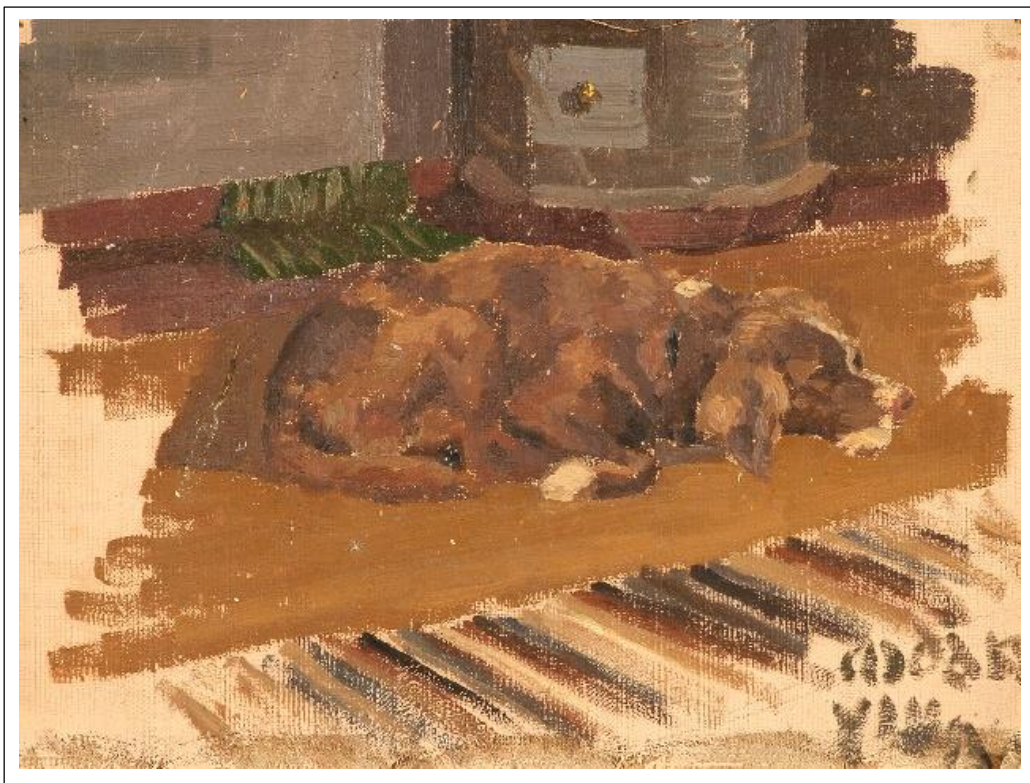
Собака ушла. 1890-е.