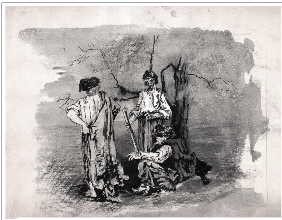
Н.К. Рерих. Запорожцы у сломанного дерева. 1894.

Отдел рукописей ГТГ. 44/24. л. 6. 6 об., 7. 7 об.